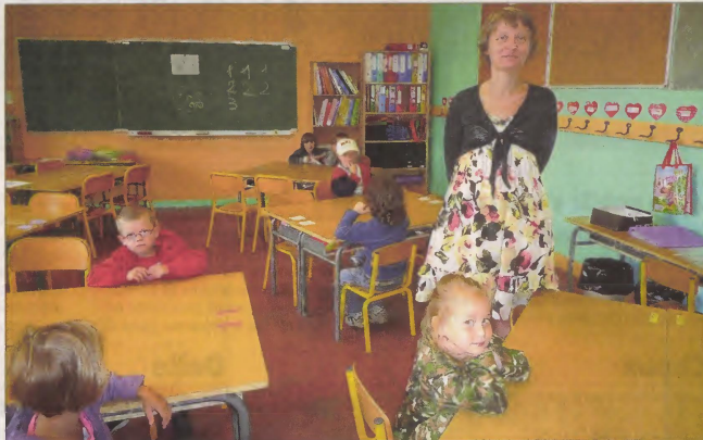
Les écoliers de primaire, sous la direction de Chantal Dirand, participent chaque semaine à des ateliers, basket et expression notamment.

La transition se passe en douceur entre primaire et collège, notamment grâce à l'enseignement des langues. Un suivi est assuré en